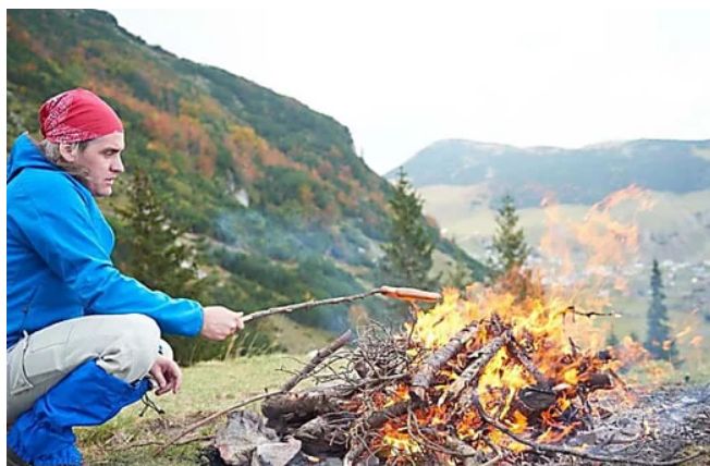
Quiz: Könntest du in der Wildnis überleben?