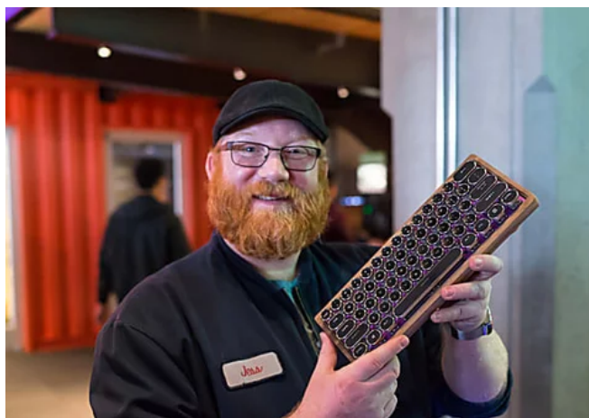
Dieser einfache Trick schützt Ihren PC kostenlos