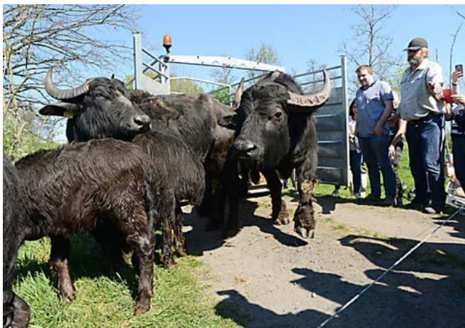
James und Gefolge sind zurück