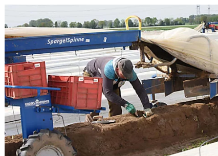
Knochenarbeit auf dem Acker