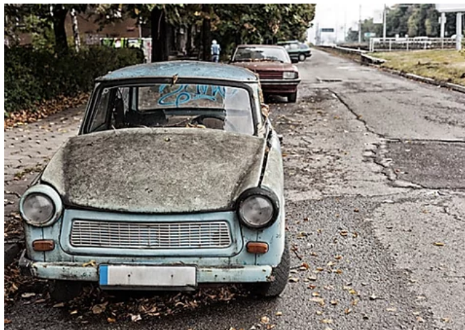
Flops der Automobilindustrie: 9 der schlechtesten Autos aller Zeiten