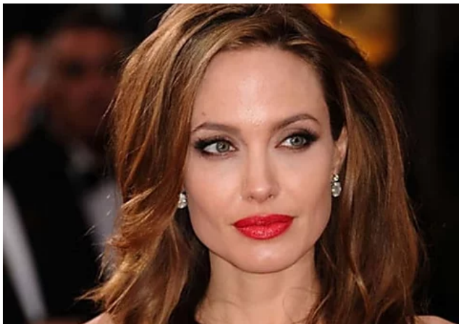
Stars ungeschminkt: Die nackte Wahrheit