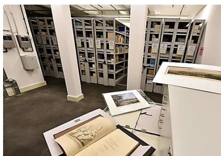
Stadtarchiv Bad Homburg: Mehr Nutzer im Lesesaal