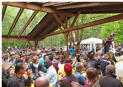
Feiern im Großauheimer Wald