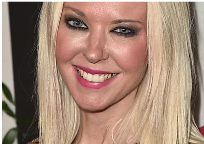
Trauriger Schönheitswahn: 9 Stars, die nicht wiederzuerkennen sind!