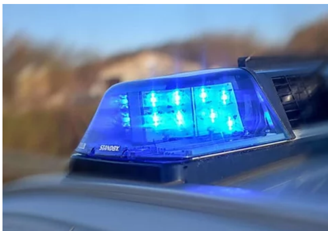
Unfall auf A3 verursacht 20 Kilometer Stau Richtung Frankfurt