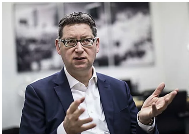
Schäfer-Gümbel: Schwarz-Grün liefert keine Zukunftsideen für Hessen