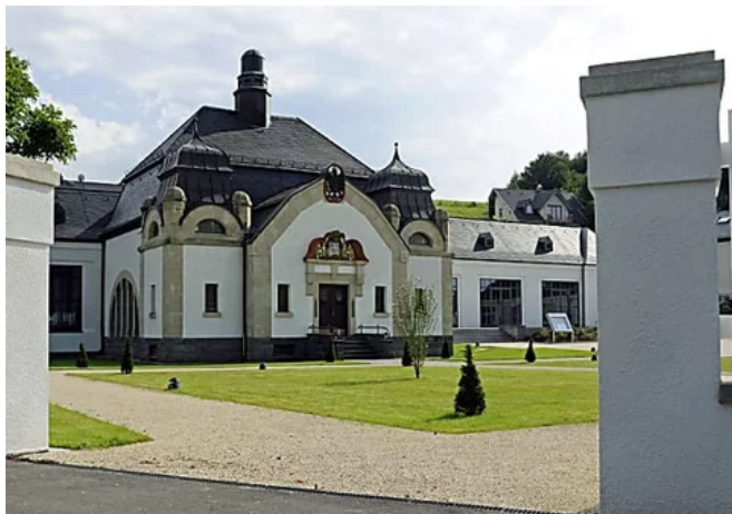
Selters: Mineralwasser für Europa