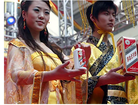
Zwei Mal waren deutsche Auswanderer die Gründer: Die 50 wertvollsten...