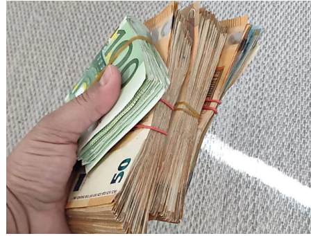
Eine Investition von € 250 in Unternehmen wie Netflix könnte Ihnen ein zweites...